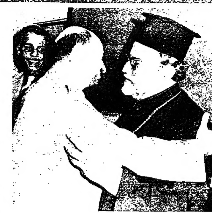
عرفات يرحب بالمران الحاج امس